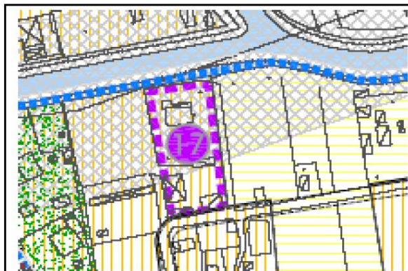
estratto PI - 1:5.000