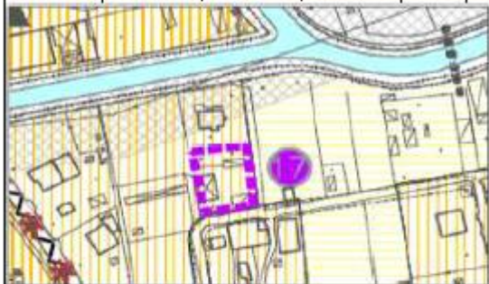
estratto PI - 1:5.000